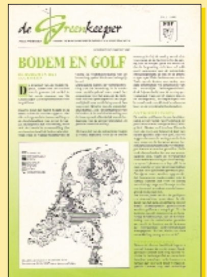
Een aantal exemplaren van het vakblad Greenkeeper, zoals dat door Brewer en Collinge gemaakt werd.