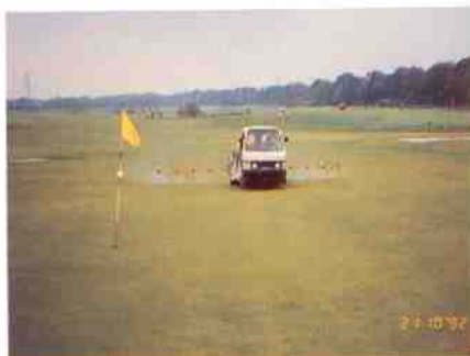
Bestrijdingsmiddelen, een apart aandachtspunt!