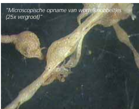
"Microscopische opname van wortelknobbeltjes (25x vergroot)"