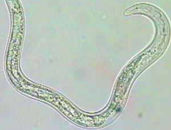
"Larve van het wortelknobbelaaltje (400x vergroot)"