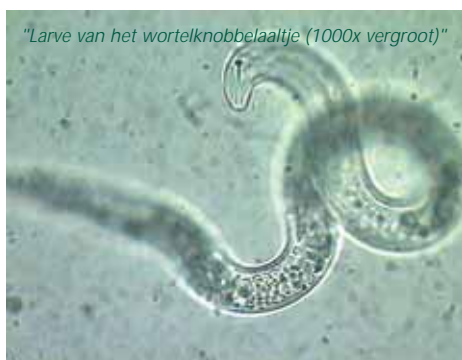
"Larve van het wortelknobbelaaltje (1000x vergroot)"