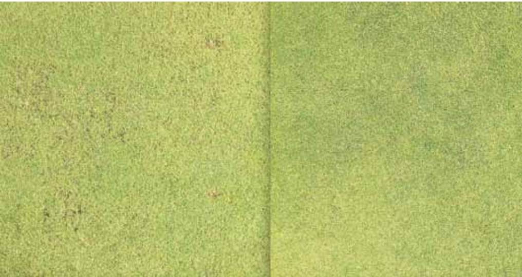
Het veld voor en na behandeling met Magnation.

www.Fieldmanager.nl/artikel.asp?id=17-5798